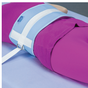
PAS NA BRZUCH