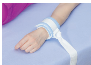
OPASKA NA KOŃCZYNĘ PLASTIKOWE OCZKO