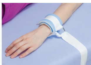
OPASKA NA KOŃCZYNĘ METALOWE OCZKO