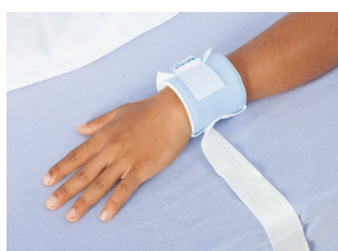
OPASKA NA KOŃCZYNĘ NA RZEP