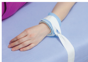
OPASKA NA KOŃCZYNĘ NA RZEP Z PĘTLĄ