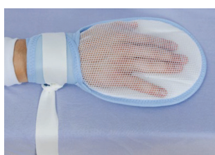
RĘKAWICA OCHRONNA NA RZEP